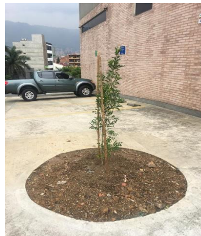
Foto 2. Siembra de nuevos individuos forestales en los sitios donde antes estaban los dos estipes de la palma real ( Roystonea regia ). 27/04/2021