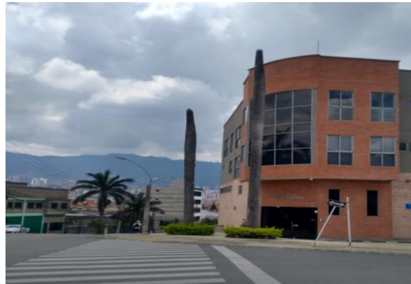
Foto 1. Estado de los estipes de las Palmas antes de la tala el 19/04/2021. Dato tomado del IT N°. 002407 de 19/08/2020.

En la siguiente fotografía (1), se muestra el estado en el que se encontraban los dos estipes de las Palmas muertas en pie, ubicados en la zona verde externa del proyecto constructivo, antes de su tala, realizada el 19/04/2021.